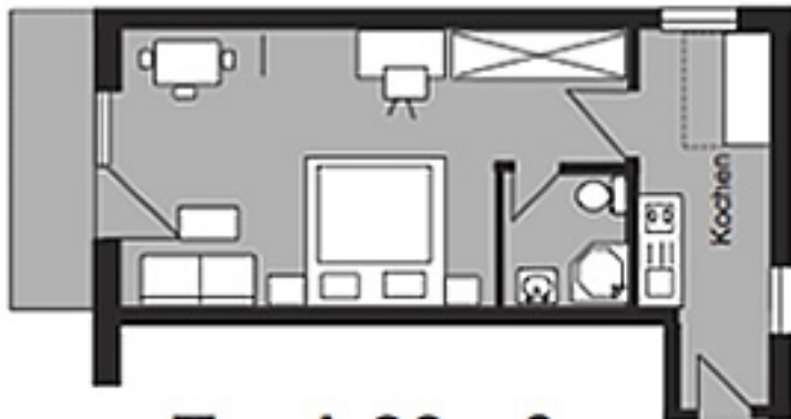
Typ A 36 m 2